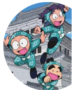
NHK アニメワールド「忍たま乱太郎」

金閣寺や銀閣寺など観光もしたけど、撮影日は夜中過ぎまで掛かることも何度かあり、髪と衣装のまま待つのが暑くて大変だった。始業式の前日アップして、東京に帰ってこれてホッとしたー！ 封切りは来年八月予定♪ みんな楽しみにしててね☆